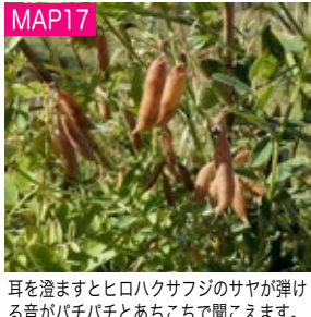
MAP17 耳を澄ますとヒロハクサフジのサヤが弾ける音がパチパチとあちこちで聞こえます。