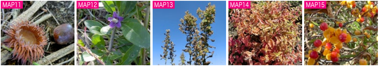
MAP11 カンワはたくさんのドングリをつけましたが、ほとんど枝から落ちました。動物のエサになります。 MAP12 赤い実が生薬として利用されるクコが、ひっそりと花を咲かせていました。 MAP13 青い秋空に映えるコガネギク。花を終えて綿毛状の実に変わっていきます。 MAP14 花期の長いナミキソウでしたが、さすがに花が終わり、葉が紅葉しています。 MAP15 ツルメモドキの実が割れて朱色の仮種皮に包まれた種子が現れました。