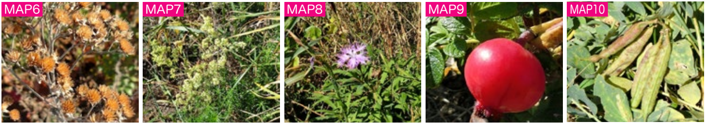
MAP6 ノコギリソウの小さな果実が集まって結実した様子は、フサフサした感じで美しい。 MAP7 エゾカワラマツバの秋株が、あちこちで淡黄色の花を咲かせていました。 MAP8 エゾカワラナデシコの秋株も園内でポツリポツリと開花しています。 MAP9 真っ赤に熟した遅咲きハマナスの実は、ピカピカ輝き、園内を彩ります。 MAP10 9月に咲いたハマエンドウの花は実になり、サヤがまるまると成長しました。