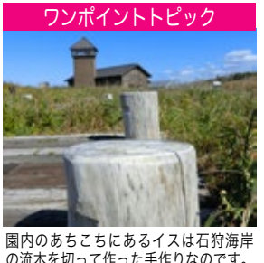
園内のあちこちにあるイスは石狩海岸の流木を切って作った手作りなのです。