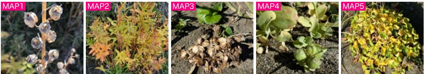
MAP1 観察園の湿原性植物のエリアではサワギキョウが結実しています。 MAP2 クサレダマの株の葉が黄色や紅色に染まって秋色ですね。 MAP3 ハマボウフウは実が落ち、一年のサイクルを終えた茎の隣から、若い葉が成長しています。 MAP4 花を終えたウンランが結実し、球形の実ができました。 MAP5 全体に黄色味を帯びたイソスミレの株。閉鎖花による実も見られます。

石狩浜海浜植物保護センターの裏に広がる観察園は、石狩浜に生育する植物を集めた植物園です。遊歩道に沿ってたくさんの種類の植物が植えられており、海浜植物をまとめて間近に親しめる穴場なのです。今回の取材は10月15日。閉園まであと約2週間と迫っているこの時期、多くの種類の植物は結実を終えて、また新たな命をスタートさせていました。力強いエネルギーの循環を実感します。