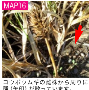
MAP16 コウボウムギの雌株から周囲に種(矢印)が散っています。