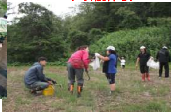
アスパラ収穫体験