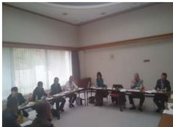
自治会連合会定例会で活動報告