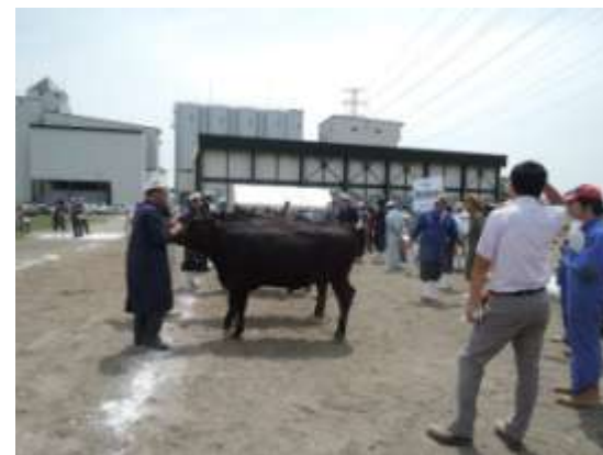
肉牛共進会を見学