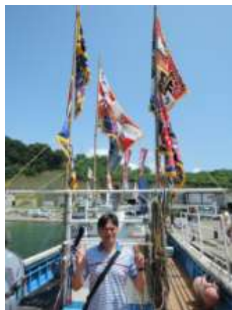
浜益のお祭りで漁船に乗船