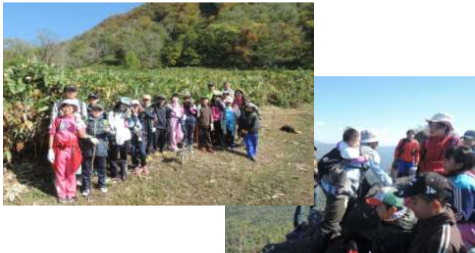
小学生とともに黄金山登山