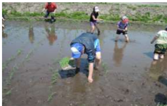
小学生とともに田植え体験