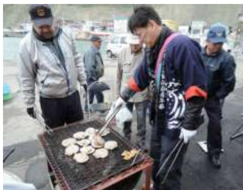
朝市でのホタテ焼き、魚貝類販売