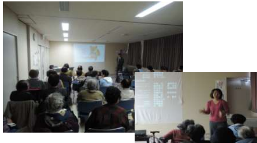
生きがい映画劇場on地域おこし協力隊