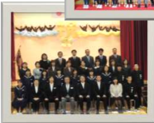
←第68回浜益中学校 卒業式(3/13)