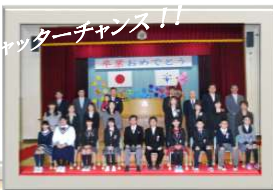
第16回浜益小学校 卒業式(3/22)→