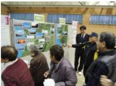
お気に入り地図で投票する参加者 「地域おこし協力隊活動報告会」(3/15)

（回答）業務委託料が約六百三〇万円、新車購入費が約四百万円である。 次に、②黒毛和牛レトルトプロジェクト検討会について、地域振興担当より報告がありました。 二月一七日、花川北コミセンでの「牛チャシュー」試食会アンケート結果を報告しました。 【アンケート結果】 ●回答者数 四六名 ●年代別では、二〇代〜四〇代に高評価(五点満点、四・二点) ●男女別では、女性に高評価(同、四・一点) ●五〇代、六〇代、男女別で「食感」の項目が低評価(同、二・九点)