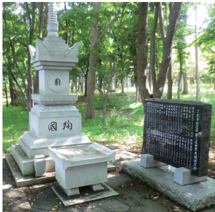
殉国写経塔(了恵寺境内)