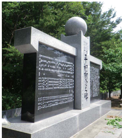
戦没者慰霊平和祈念之碑(創生園内)