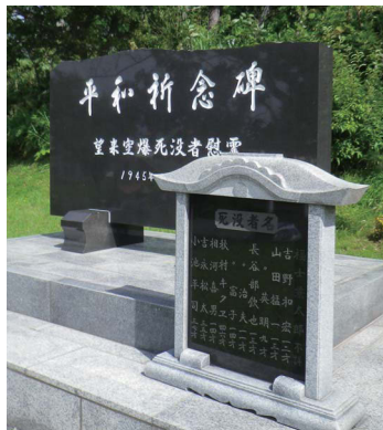
平和祈念碑(厚田区望来)