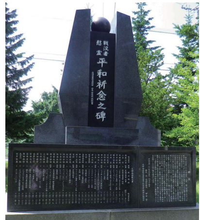
戦没者慰霊平和祈念之碑(花畔神社境内)