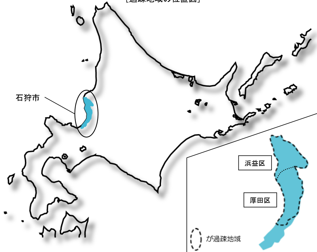
[過疎地域の位置図]

気候は、対馬海流の影響による海洋性気候で、春から夏、秋にかけてはしのぎやすく、冬は季節風の影響などにより積雪は多いものの気温較差が少なく、日本海地域の中でも比較的温暖な地域となっています。