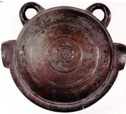
銘「松前城下村山傳兵衛」 「寛政三辛亥年三月吉日」