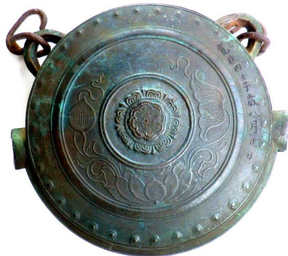
銘「寛政四壬子八月廿日」