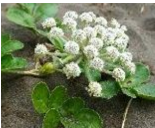
ハマボウフウ(セリ科) 細かい花がいっぱい集ま っているよ!