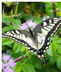
キアゲハ 幼虫はセリ科の植 物を餌にするよ。