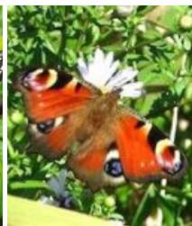
クジャクチョウ 成虫で越冬するチ ョウなんだよ!