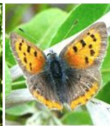
ベニシジミ 明るいオレンジ色 のはね。