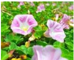
ハマヒルガオ(ヒルガオ科) ラッパ形のピンクの花 がかわいいね!