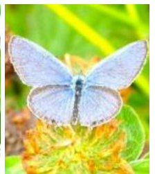
ツバメシジミ うしろばねにある 突起が特徴だよ。