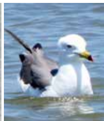
ウミネコ 名前の通り猫の鳴 き声に似ている！