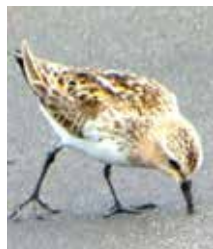
トウネン 渡りの途中で立ち 寄る「旅鳥」。