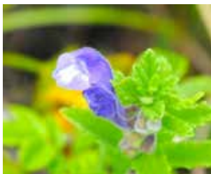
ナミキソウ(シソ科) 波が来る草と書いて「波 来草」だよ！