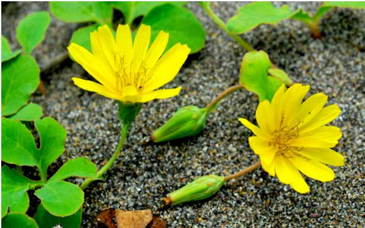
砂の下の地下茎でつながっている