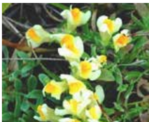
ウンラン(オオバコ科) 花の中央にあるオレンジ色の 盛り上がりがかワイね。