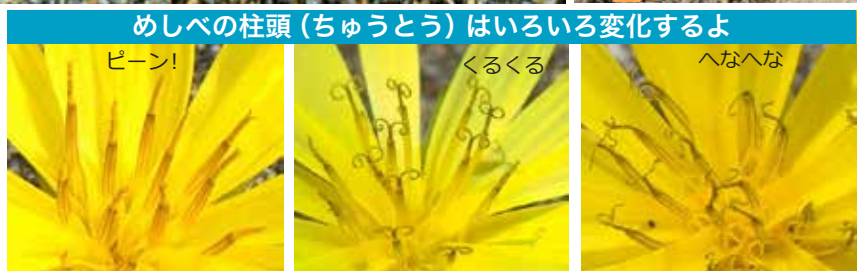
めしべの柱頭(ちゅうとう)はいろいろ変化するよ