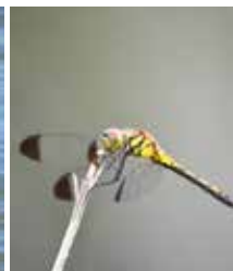
ノシメトンボ はねの先が茶色が 目印だよ。