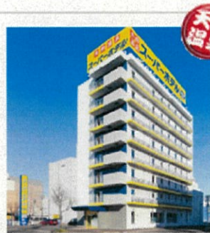
スーパーホテル 釧路