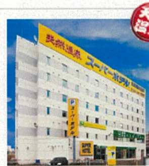
スーパーホテル 釧路駅前