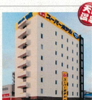
スーパーホテル 旭川