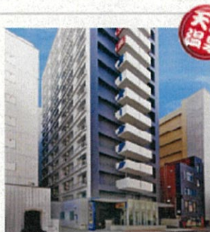
スーパーホテル 札幌・すすきの