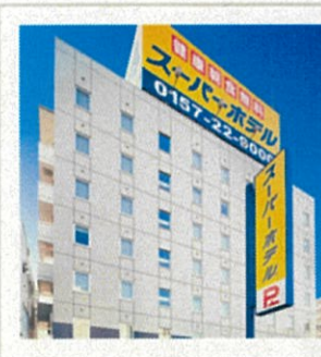
スーパーホテル 北見