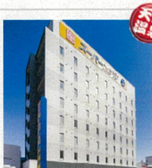
スーパーホテル 函館