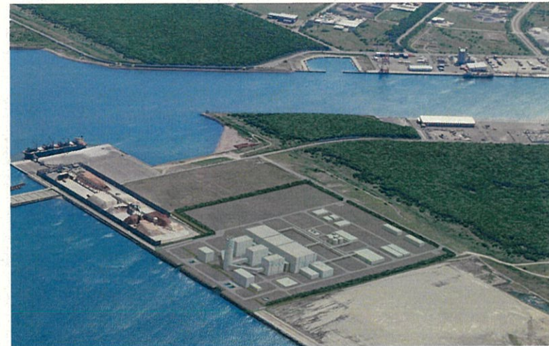
石狩湾新港発電所イメージパース（北海道電力株）