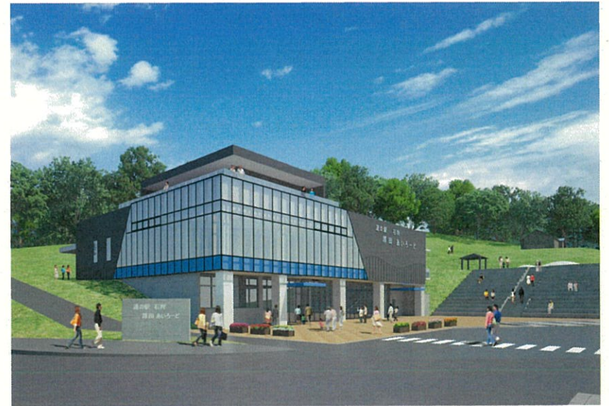
道の駅石狩「あいろーど厚田」イメージパース