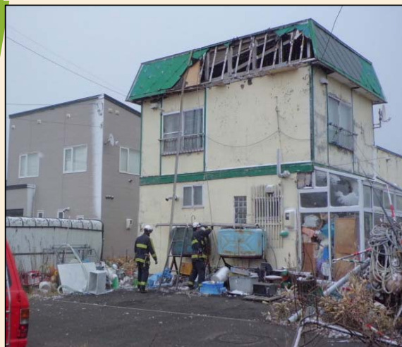
リスト番号4 親船町