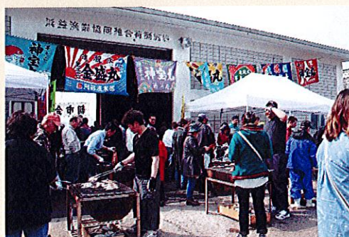
バーベキューもできる漁港朝市

人口190万人の札幌市に隣接しているため、商業施設、娯楽施設、病院など不自由なく暮らすことができます。