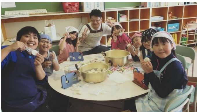
望小の皆さんと、餅撒きの準備をしました。皆の器用 な手さばきに、オジサンとお兄さんはタジタジ！！