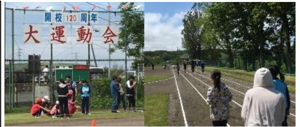
↑開校120周年！節目の大運動会！↑ 25歳のお兄さんも走りました（笑）

運動会のお手伝いで、望来小学校にお邪魔しました！ 毎年6月の運動会と10月の学芸会の時に餅撒きを行うため、前日に保護者・地域の方々が集まって準備をしています。 全校児童6名のみなど一緒にお餅の袋詰めをしました！ 翌日の本番は好天に恵まれ、児童・保護者・地域の方が、元気良く競技に参加していました。 運動好きの私も飛び入り参加！13年ぶりの運動会でした！！