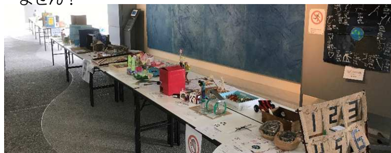
「創意工夫展」展示会場。

僕らの頃より大幅にレベルアップしていて感心しきりでしたが、厚田っ子の力作が多かったことにも感激しました!来年以降も、このイベントからは目が離せません!