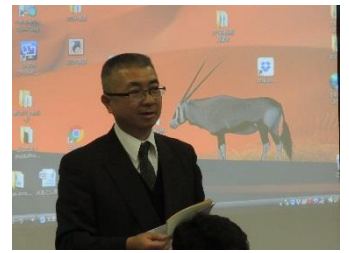
まず川村校長先生が浜益への熱い思いを語ってくださいました。