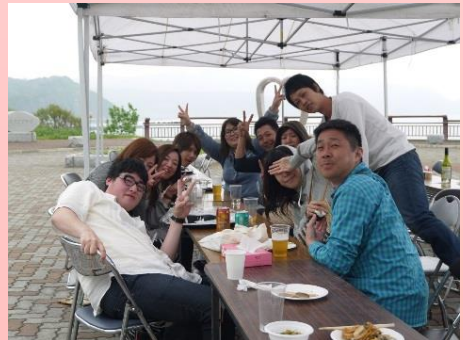
バーベキューで盛り上がる参加者のみなさん

参加者の方々には、昼食に活ホタテ丼、そして夕食では、ホタテやタコ串・白貝などの浜益の海産物、浜益牛、そして朝採りのアスパラなどの浜益の農産物でバーベキューしました。お土産には、ふじみやさんのどら焼きと、浜益の食を堪能してもらいました。