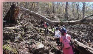
険しい山道では少しへこたれそうになりました…