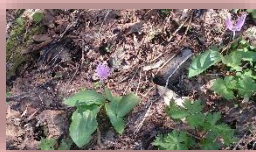
雪解けが進んだ登山道にはお花がちらほら