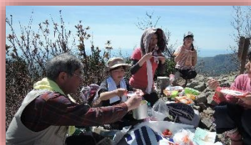
頂上ではチーズフォンデュをしながらランチパーティ。