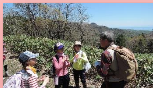
千秋さんからいろいろ教えてもらいました。