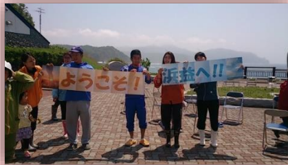
「ようこそ！ 浜益へ!!」の看板を持ってくれたみなさんも。