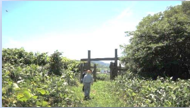
草刈りされてとても歩きやすい道になりました