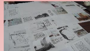
パンフの資料で机がいっぱい

今後、ハママシケ陣屋跡のパンフレット制作を予定しており、現在陣屋研究会では、その内容についての検討をしています。盛り込みたい内容は盛りだくさんですが、初めて訪れた人にもわかりやすく、かつ興味を持ってもらえるように情報を整理するなど、みんなで意見を出し合っています。