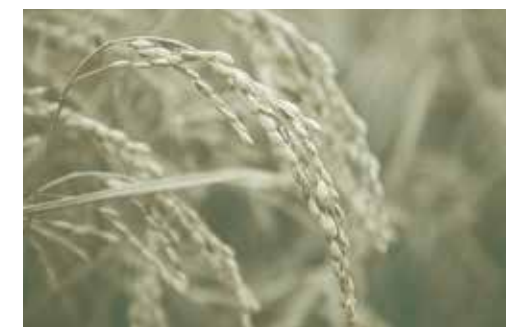
▲YES! clean(イエスクリーン)米