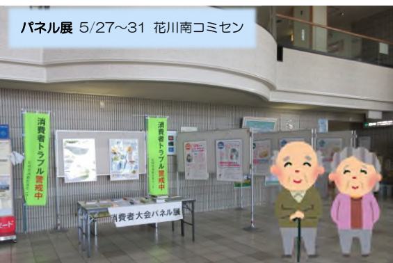
パネル展 5/27～31 花川南コミセン

サクラサイトや情報商材、通信販売など、インターネット取引に係るトラブル事例を挙げ、「つけ込まれる人間の心理」から消費者被害に遭わないための注意点を学びました。講師の軽妙な語り口に笑いも交え、参加された26名の市民のみなさんはメモを取りながら熱心に聴講されていました。