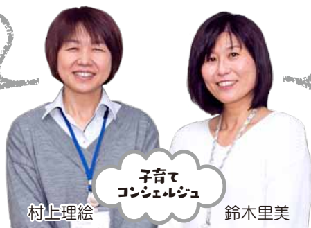
子育て コンシェルジュ