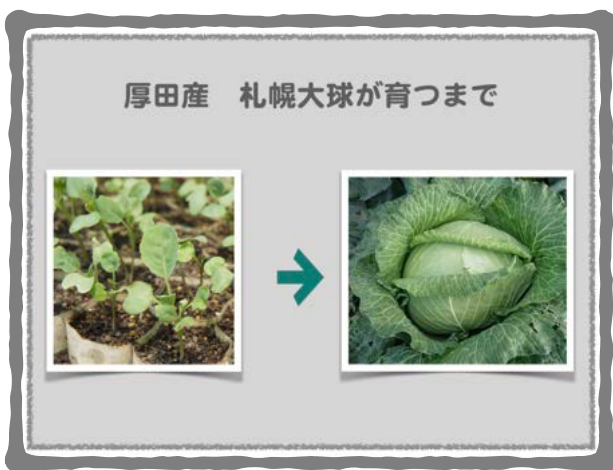
今は希少な 厚田産・札幌大球

「石狩市地域おこし協力隊」フェイスブックと共に、活動の進捗状況や報告をしていきたいと思います。 また、地域の紹介、気付きなどもサイト内で個々のページを作り、情報収集をして発信していきたいです。