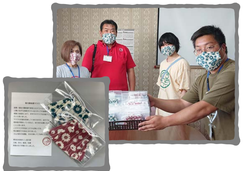
協力隊 手作り応援マスク

小さな芽から巨大なキャベツに変身する過程を、 高田ファームさんのご協力の元、記録しています。 どんな風に成長するのか私も楽しみです。 成長記録はHPで更新していきます。 ぜひ、ご覧ください。