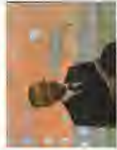
本日の川村校長先生が挨拶の様子。思いを届けてくださいました。