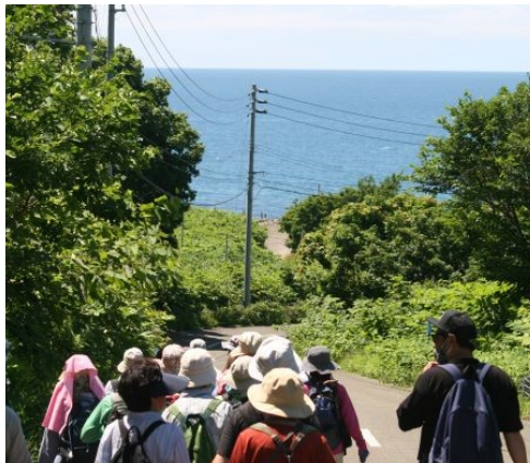
幌市道から海を望む

まちづくり推進協議会が開催した 「はまますいっぺかだれやフット パス」について報告がありました。 当日は区外から26名が参加し、 アンケートの回答からも好評と の報告がありました。コロナ禍 でも実施できるイベントとして 定着が期待されます。