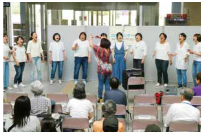
▲ロビーコンサート