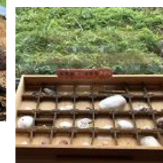
8月 ひそかに人気 貝の標本箱