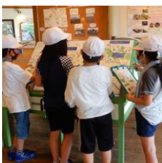
9/7・9 環境学習で 市内小学校利用