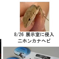
8/26 展示室に侵入 ニホンカナヘビ