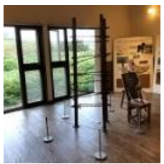
8/29-10/5 連携企画 「石狩浜の百年記念塔」