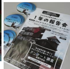
10/19-11/3, 12/7-18 活動報告展