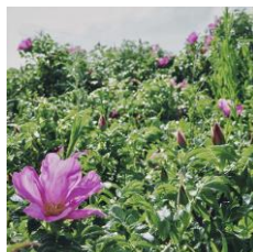
6月 人はいないが ハマナス満開