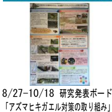
8/27-10/18 研究発表ボード 「アズマヒキガエル対策の取り組み」