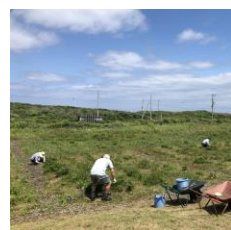
7/8~「ハマナス Healthy タイム」 ようやく開催