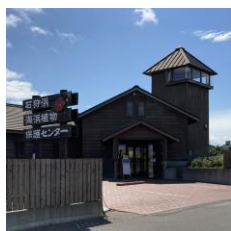
9/4 看板きれいに なって移設