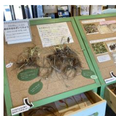
7/27-9/7 季節展示 「砂の中の世界」