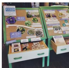
5月 砂丘ノート はじまる