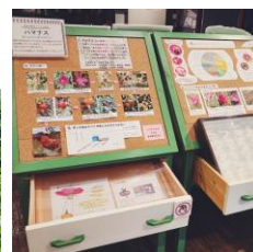
5/28-6/26 展示室は ハマナスづくし