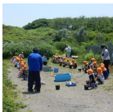
7/6 小さなお手伝い さんたち、苗を植替え