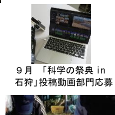
9月 「科学の祭典 in 石狩」投稿動画部門応募