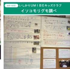
6/4-6/22 とっておき 掲示板「石狩浜の イソコモリグモ調べ」