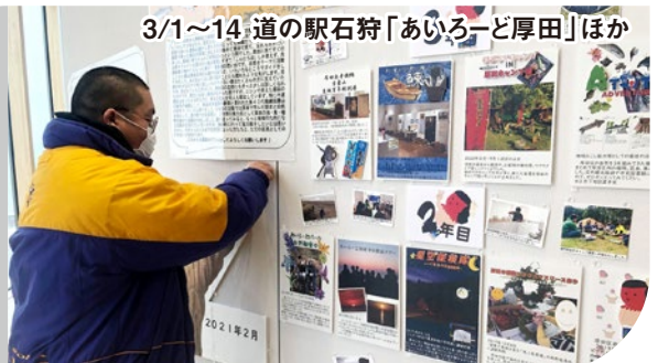
3/1~14 道の駅石狩「あいりーど厚田」ほか

コロナ禍のため、厚田・浜益・石狩の3会場を巡回するパネル展で、隊員6人の活動を報告することに。4/1(木)~15(木)まで市民図書館で展示しますので、ぜひご覧ください!