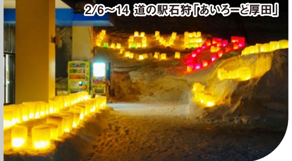
2/6~14 道の駅石狩「あいりーど厚田」

新型コロナウイルスの終息を願い、LEDライトを使ったアイスキャンドル200個を道の駅に設置し、ライトアップを行いました。