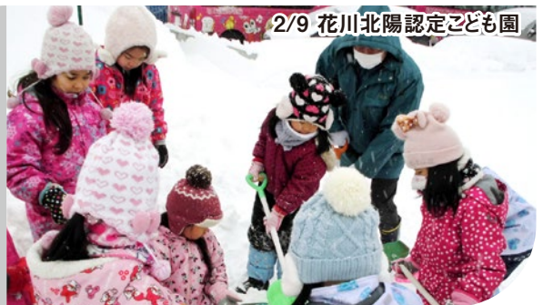
2/9 花川北陽認定子ども園

花川北陽認定子ども園から友好都市・恩納村の子どもたちへ雪をプレゼントするのは本年で4回目。年長さんが前日に降ったパウダースノーを発泡スチロールに詰め込みました。