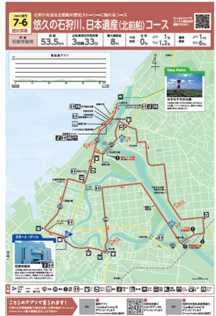
石狩市役所発着歴史探索コース