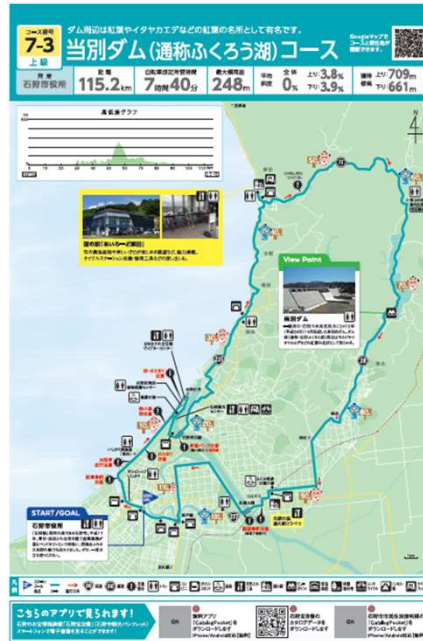
石狩市役所発着上級コース