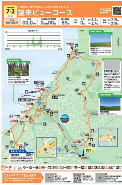
石狩市役所発着中級コース

引き続き、基幹ルートである石狩北部・増毛サイクルルートの整備を行うとともに、利用者の多いモデルコース（下記の地域コース）にも重点的に案内看板と路面表示を設置する予定です。