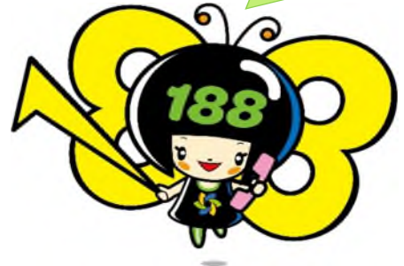
消費者庁 消費者ホットライン188 イメージキャラクター『イヤン』