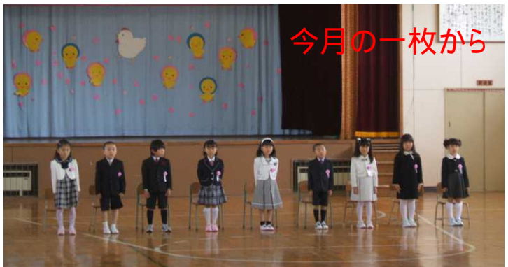
4/8 浜益小学校入学式(9名の新1年生が入学) 今年度、中学校は11名の生徒が、はまます保育園には21名(うさぎ組4名、くま組8名、ぞう組9名)の園児が入学・入園しました。