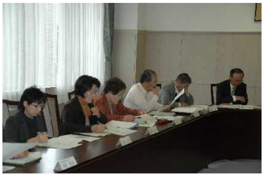
第1回浜益区地域協議会の様子

平成21年度第1回浜益区地域協議会は、4月23日(木)、8名の委員が出席し、浜益支所庁議室で開催されました。