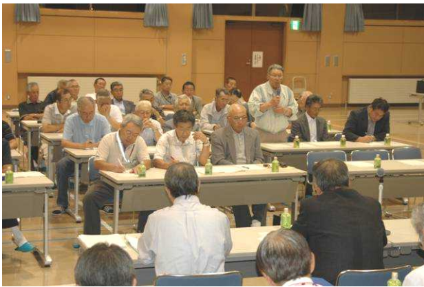
自治懇話会の様子

【とき】H21.8.27(木)18:30～19:45 【ところ】浜益コミセン きらり 【出席者】<自治会(連合会)>36名 <市議会>2名 <本庁>8名 <支所>6名 <計>52名 【意見交換テーマ】 自治会館の維持管理費助成について(群別自治会) 海岸美化対策について(群別・幌自治会) 市道から会館までの道路整備について(幌・実田自治会) その他