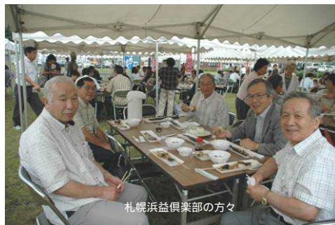
札幌浜益倶楽部の方々