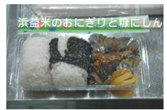
浜益米のおにぎりと糠にしん