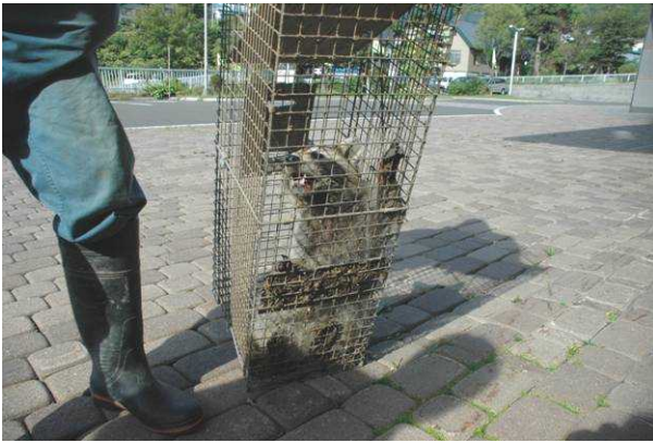
箱罾で捕獲されたアライグマ

旬の海産物や農産物の直売に多くのお客さんが訪れますが、その一方、アライグマによる農産物への被害が急増しています。トウモロコシが好物のようで、ここ数週間は毎日のように被害の連絡があり、8月には11頭が箱罾で捕獲されました。一度に5頭の子を産むと言われるアライグマ。見かけは可愛く、おとなしいのですが、浜益区の地域振興のため、皆さんの声を遠慮なく最寄りの委員や事務局にお届けください。この浜益区は地域みんなの手で創り上げていきましょう。