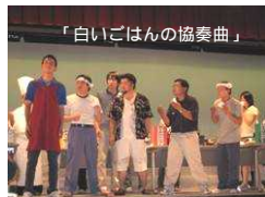
「白いごはんの協奏曲」