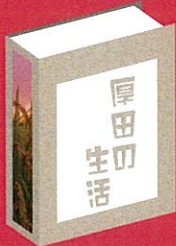
写真 SNS 「coten」 上にて二週間限定公開