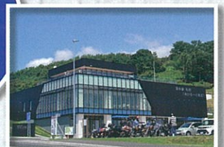
道の駅石狩「あいろーど厚田」 ※国道231号沿い