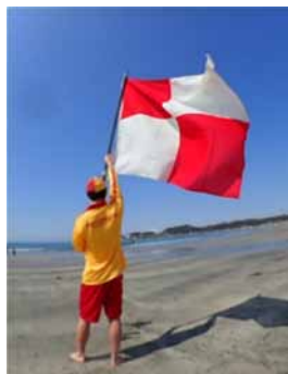
▲赤と白の格子模様の旗