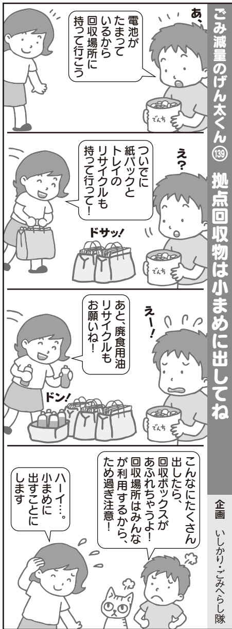
ごみ減量のげん太くん 139 拠点回収物は小まめに出してね