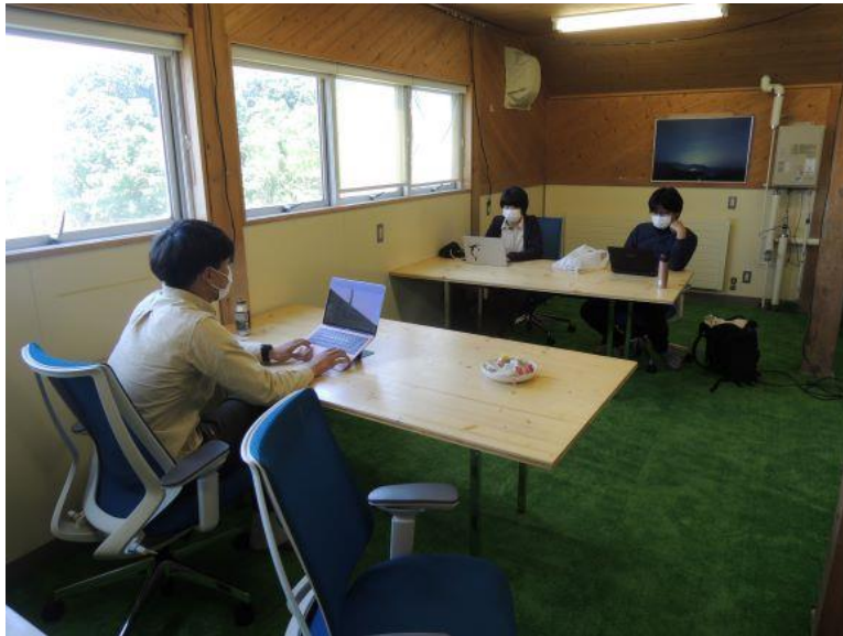
ワーケーションの推進