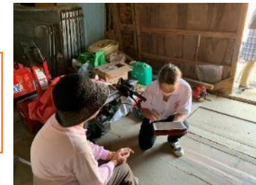
アンケート調査、生活状況聞き取り