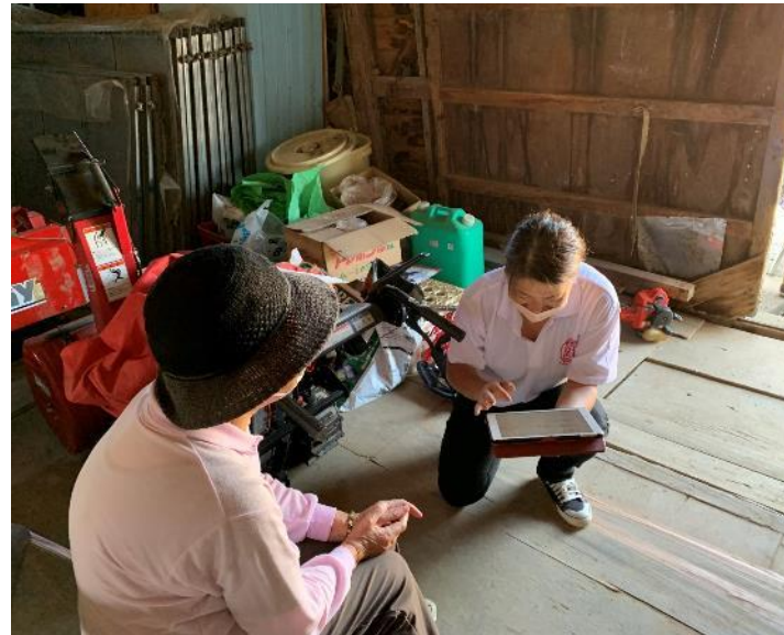
地域住民アンケート/要望聞き取り/空き家物件探し/生活サポート/就労支援