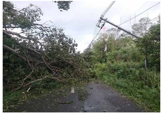
▲平成30年台風21号による被害