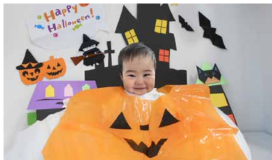
▲10月は「つくって撮ろう!～かぼちゃベスト～」