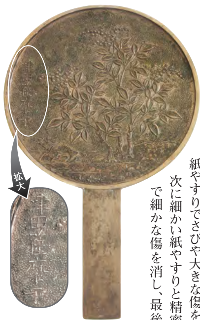
写真① ナンテン模様の裏面 (左側に「津田薩摩守」の文字が入っている)

作業には、紙やすり・精密やすり・研磨剤とクロスなどの現代の道具を使用しました。はじめに紙やすりでさびや大きな傷を落とし、次に細かい紙やすりと精密やすりで細かな傷を消し、最後に研磨