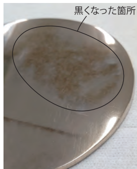
写真④ 1カ月経過した状態