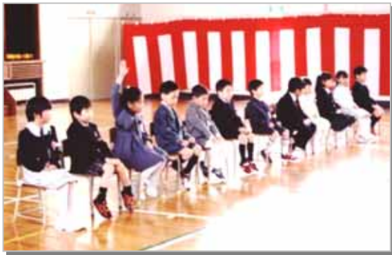
4/8 浜益小学校入学式より... 元気いっぱいの12名の新生児

して今年が最後の入学式となる浜益 高校では1名の新入生をそれぞれ迎 えました。また、はまます保育園で 24名(つぎ組7名・くま組9名・そ う組8名)の園児が入園しました。 楽しい学校生活を過ごせるよう地域 ぐるみで子どもたちを守りましょ う。次代を担う地域の宝には、遅くそし て優しく育ててもらいたいものです。 浜益区の地域振興のため、皆さんの声 をご遠慮なく、最寄りの委員や事務局に お届けください。この浜益区は地域みん なの手で創り上げていきましょう。