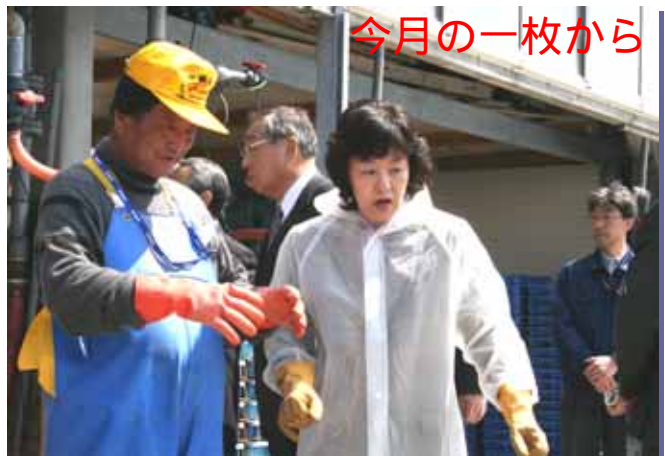
4/15「知事まちかど対話」より...高橋はるみ知事が公式初、 浜益区を訪問。浜益漁港でホタテの水揚げ作業を視察、作業を体験。

【支所民生生活課からのお知らせ】5月は軽自動車税第1期、固定資産税第1期の納期です。忘れずに納期内に納めましょう。