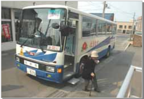
浜益スクールバス(一般混乗) 〔はまなす号〕