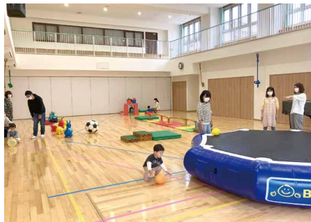
▲ホールには大きなトランポリンがあり、お子さんと一緒に楽しめます!