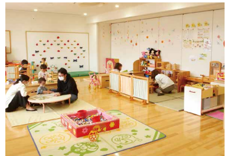
▲ミニ滑り台やクライミングウォールがあり、ベビーベッドも設置しています