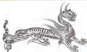
写真① 国宝キトラ古墳壁画の白虎 （写真は一部分）〈国（文部科学省所管）〉