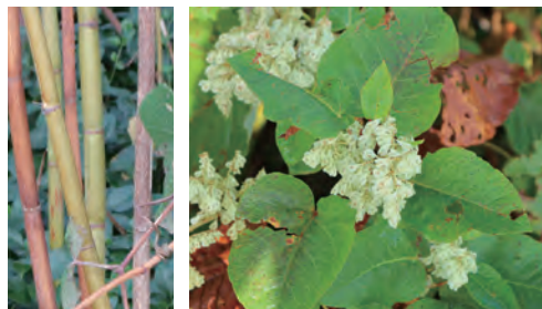
写真② オオイタドリ／大虎杖（石狩市内）