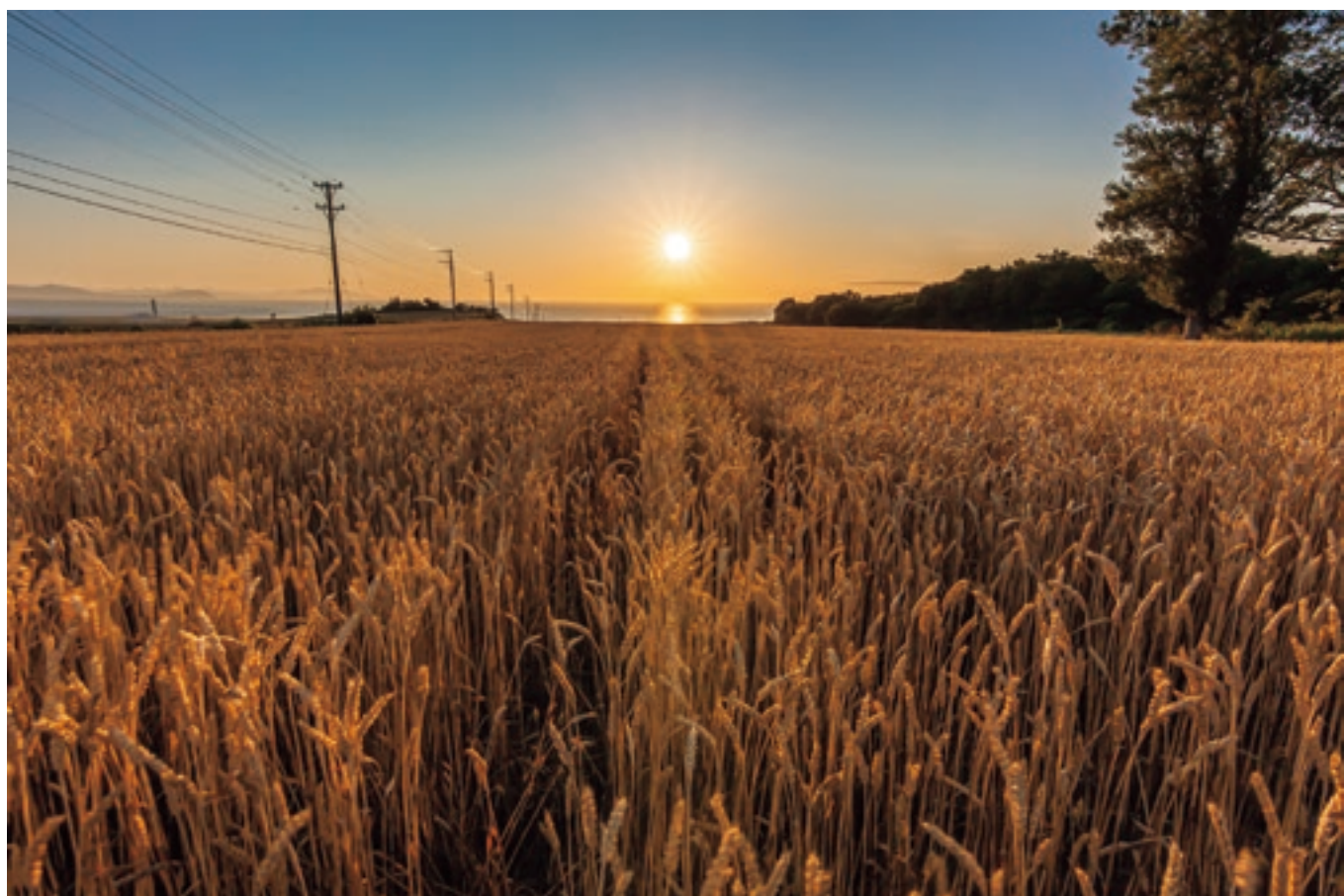
黄金色に染まる麦穂（厚田区聚富）