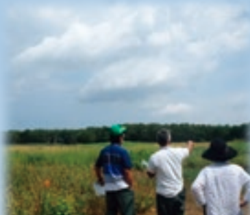
8月5日 花畔樽川地区