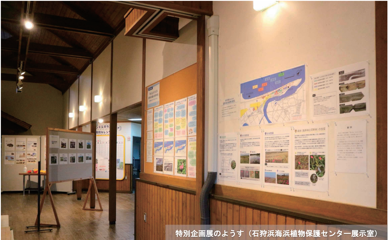
特別企画展のようす（石狩海浜植物保護センター展示室）