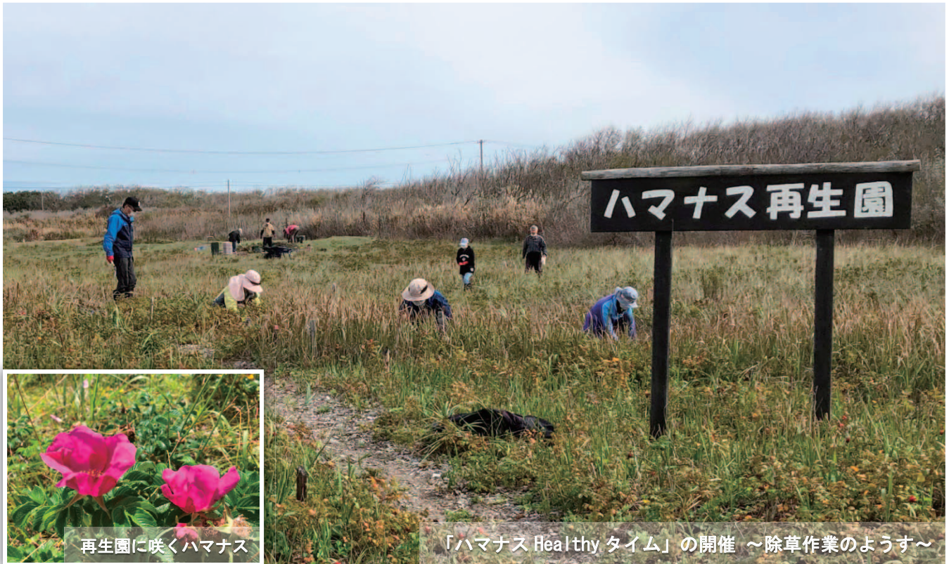
再生園に咲くハマナス