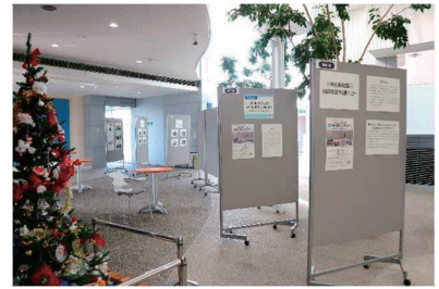
特別移動展のようす(石狩市民図書館)