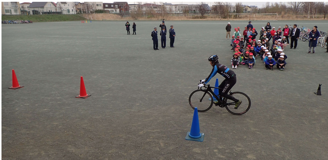
令和元年度の開催状況 緑苑台小学校では正しい乗り方やルールを教わりました

引き続き、学校における交通安全教育を推進するため、小中学校でプロガイドによる交通安全教室を開催する予定です。