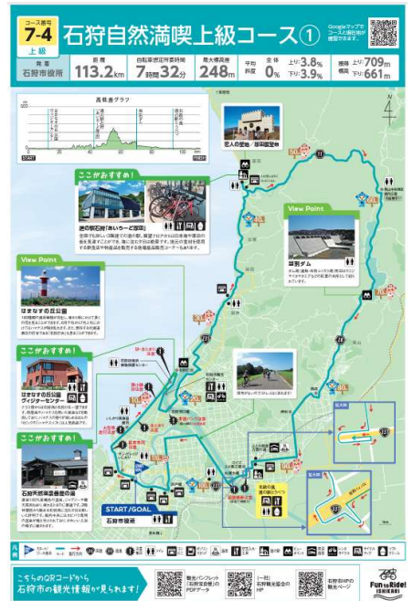
石狩自然満喫上級コース