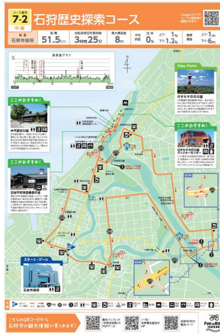
石狩歴史探訪コース