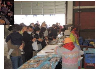
浜益ふるさと市場 (みなと朝市)