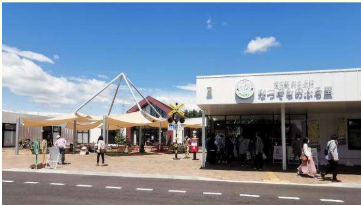
令和4年4月にリニューアルオープンした道の駅おとふけ

柳月スイートピア・ガーデンに隣接する「道の駅おとふけ」は、公募型プロポーザル方式で施行、運営事業者を選定し、令和4年4月に移転、リニューアルオープンしました。十勝で絶大な人気を誇る「満寿屋商店」が営む十勝産小麦100%ベーカリー「みちます」などを始めとする「とちかの食の集結」をコンセプトに、音更町産を使ったラーメン、そば、うどんなど何度も足を運びたいくなるお店が並んでいました。また、2019年NHK連続テレビ小説「なつぞら」が体感できるセットの施設もあり、コロナ禍でドラマ放映後の集客が思うように見込めなかったようですが、今後の観光拠点として期待されるスポットです。さらに、道東自動車道の「音更帯広インターチェンジ」近くに位置し、札幌や釧路方面を結ぶ交通や、災害時の防災拠点、避難所としての活用も見据えて、関連施設含め駐車場が約800台分整備されています。そのため、オープン当初は渋滞もなく、グランドオープンから11日目にして10万人を突破、今後注目される道の駅になりそうです。