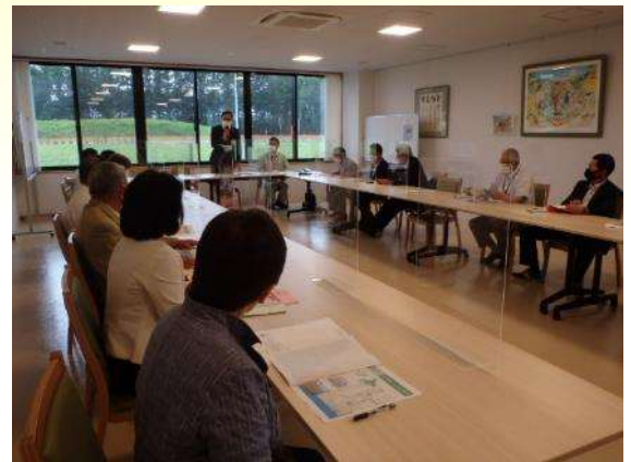
音更町産業連携課職員から説明を受けました