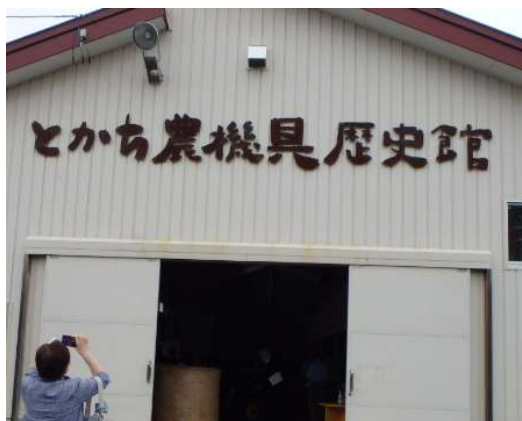
いただきますカンパニーが運営する農機具歴史館