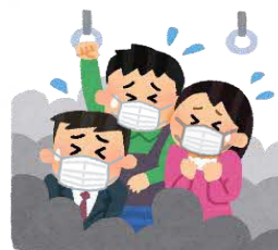
混雑した乗り物の中