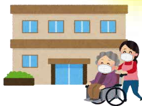
高齢者施設など に行くとき