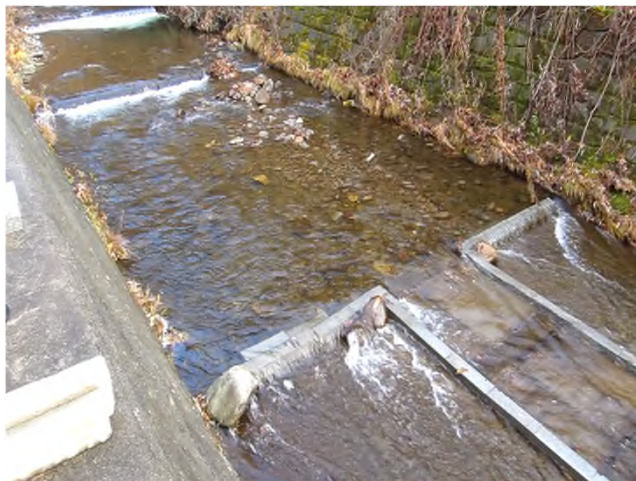
実田浄水場 滝ノ沢川