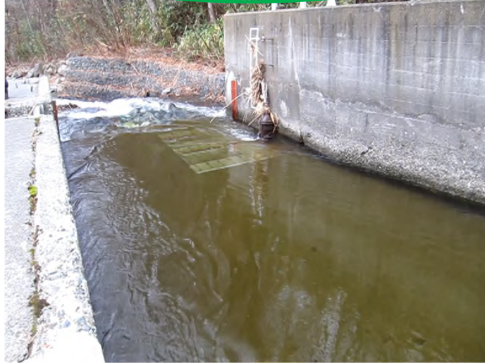
浜益浄水場 群別川