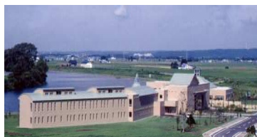
道の駅しんしのつ