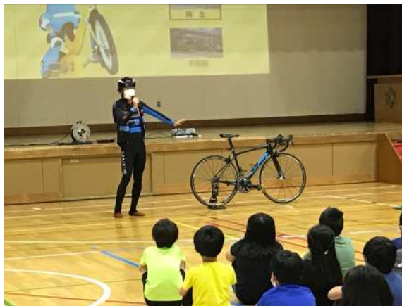
石狩市立花川南小学校における交通安全教室の実施状況