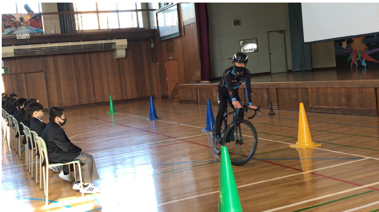
石狩市立花川南中学校における交通安全教室の実施状況