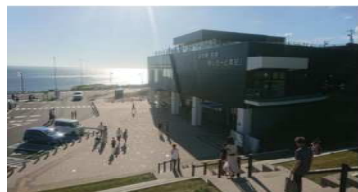
道の駅石狩「あいろーど厚田」