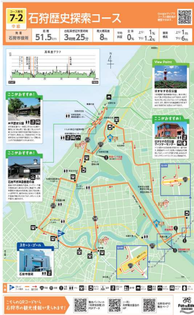
石狩北部・増毛サイクリート（地域ルート（7-2））

自転車利用者が安全快適に走行できるように、北海道のサイクルツーリズム推進方針に基づき、石狩北部・増毛サイクリートの基幹ルートと地域ルートの一部に案内看板を設置しました。