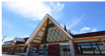
北欧の風 道の駅とうべつ