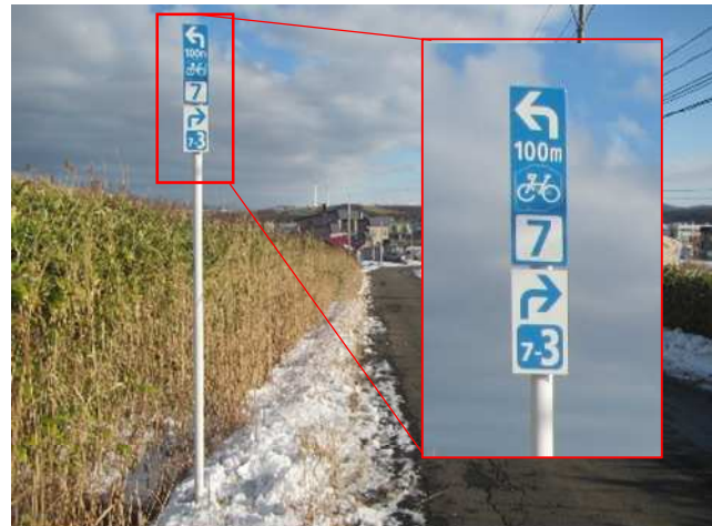
案内看板設置（基幹ルートと地域ルート）