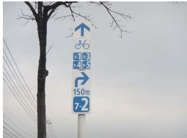
案内看板設置（地域ルート）