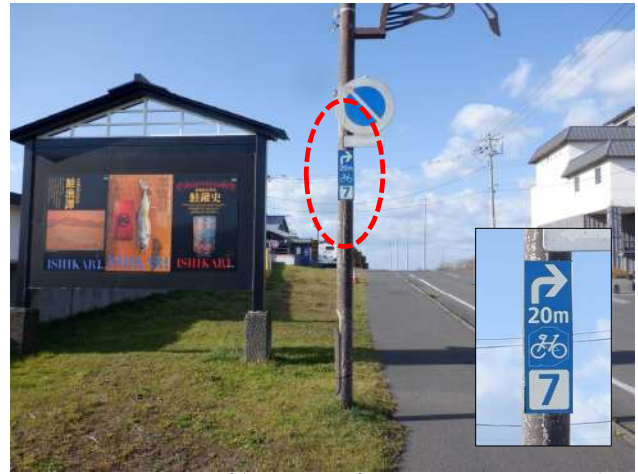
案内看板設置（参考：基幹ルート※R2年度施工）